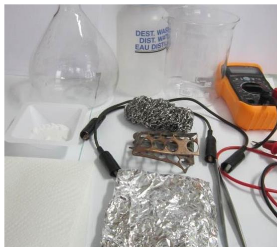
Slika 1: Osnovne potrebščine za izvedbo vaje