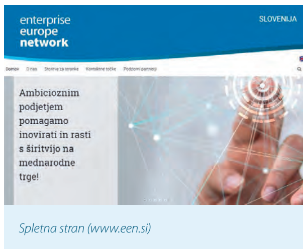
Spletna stran ( www.een.si )

Na ta način lahko zagotovimo raznovrstne in prilagojene vsebine za podjetja in ostale deležnike, obenem pa za obveščanje uporabimo najbolj učinkovit način. S tehnološkim razvojem so danes ta sredstva obveščanja dostopna praktično v vsakem trenutku in kjerkoli, tudi na zaslonu prenosnih naprav.