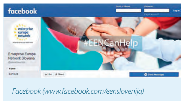
Facebook ( www.facebook.com/eenslovenija )

S prijavo na prejemanje rednega mesečnega obvestila v elektronski obliki (ang. newsletter), boste v vaš elektronski poštni nabiralnik prejeli pregled izpostavljenih dogodkov v Sloveniji in v tujini, aktualne razpise, borzo poslovnih in tehnoloških priložnosti v obliki povpraševanj in ponudb ter druge novice in objave. S samo zasnovo sledimo ustaljeni obliki strnjenih informacij v obliki spletnih povezav s kratkim povzetkom. Prejemanje novic je brezplačno.